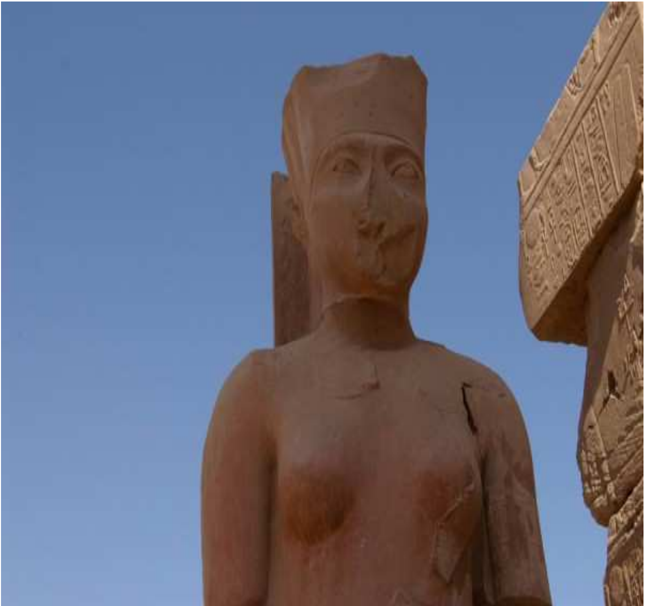
Amonet au temple de Karnak, à Louxor.