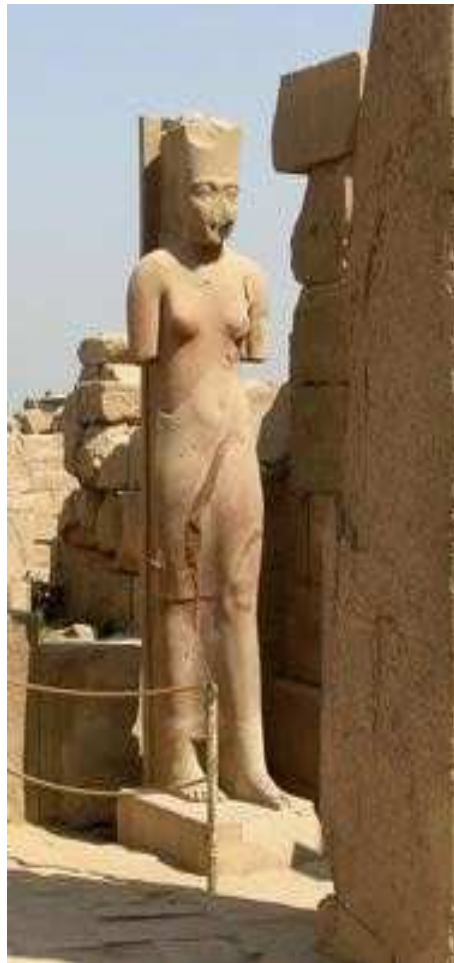
Amonet au temple de Karnak. Source