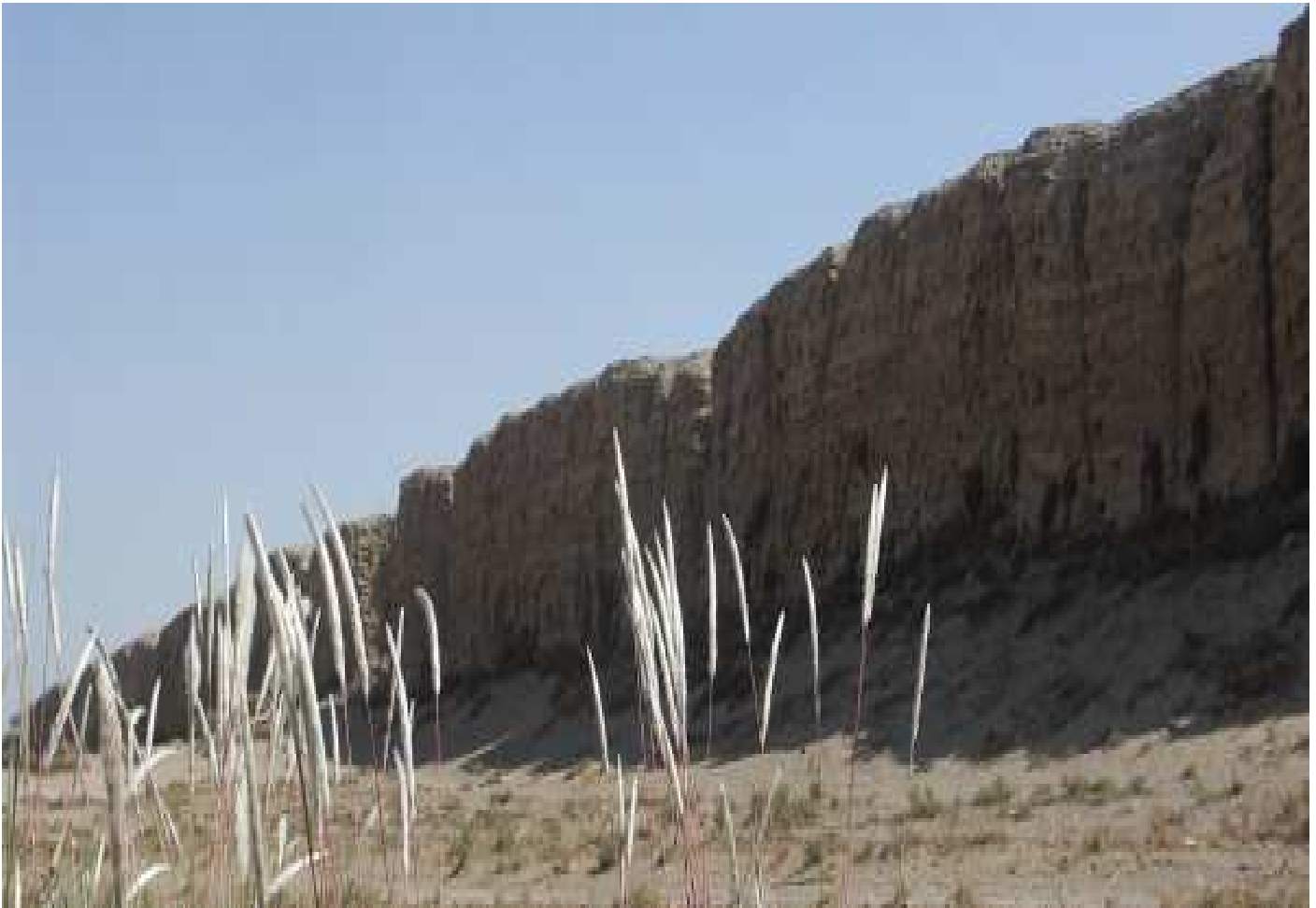
Une cité fortifiée !