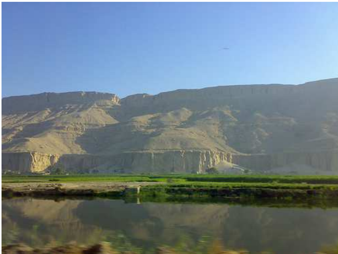
Voici Sohag ... Localisée au sud d'Assiout... Sur la rive gauche du Nil...