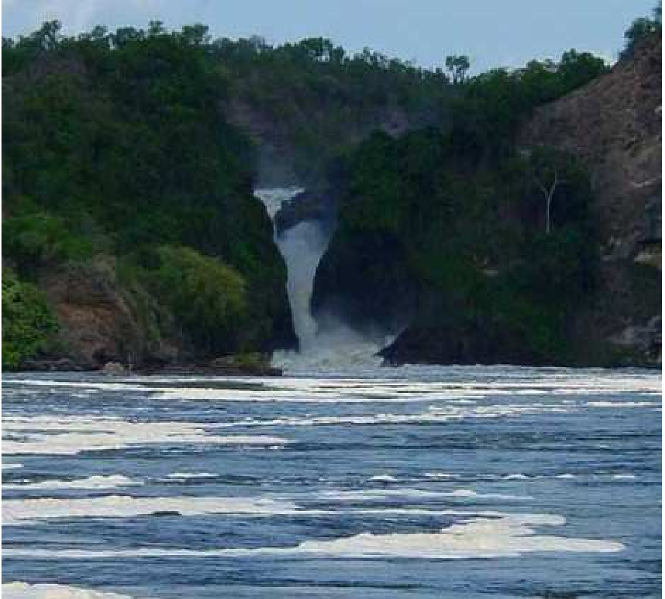
Le Nil... En Ouganda cette fois-ci !