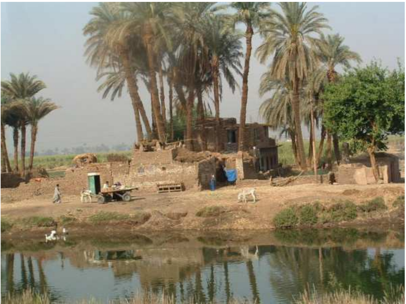
Maison au bord du Nil...