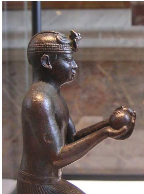
Très belle statuette en bronze du pharaon Taharqa...