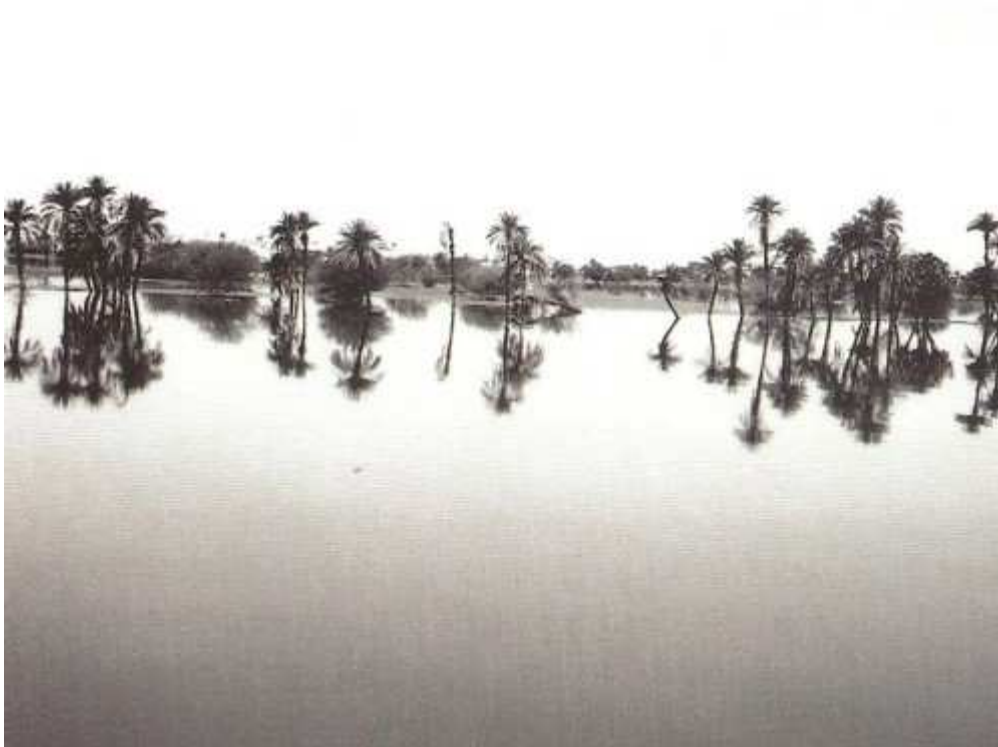
La crue du Nil, bienfaitrice mais aussi potentiellement destructrice, entre Assouan et Abou-Simbel, en 1962...