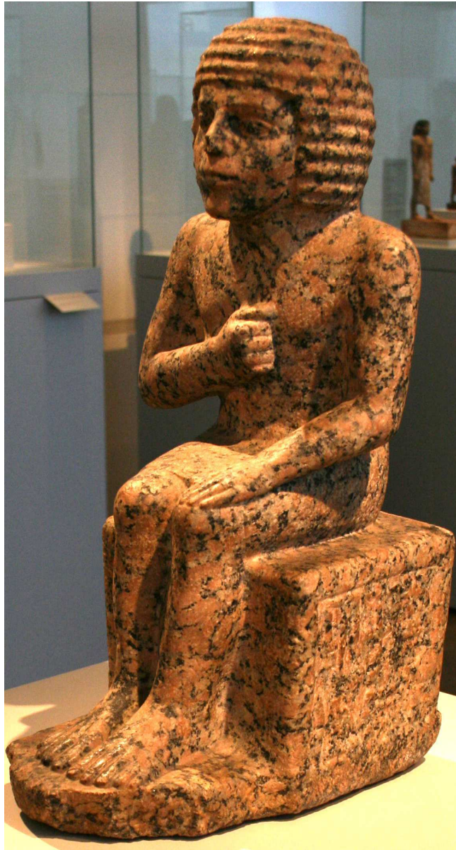
Statue de Metjen (Mtn)...

Voici donc appuyant cela, deux exemples de statuaire de cette époque bien mouvementée : - Mtn, - Et Akhethétep.