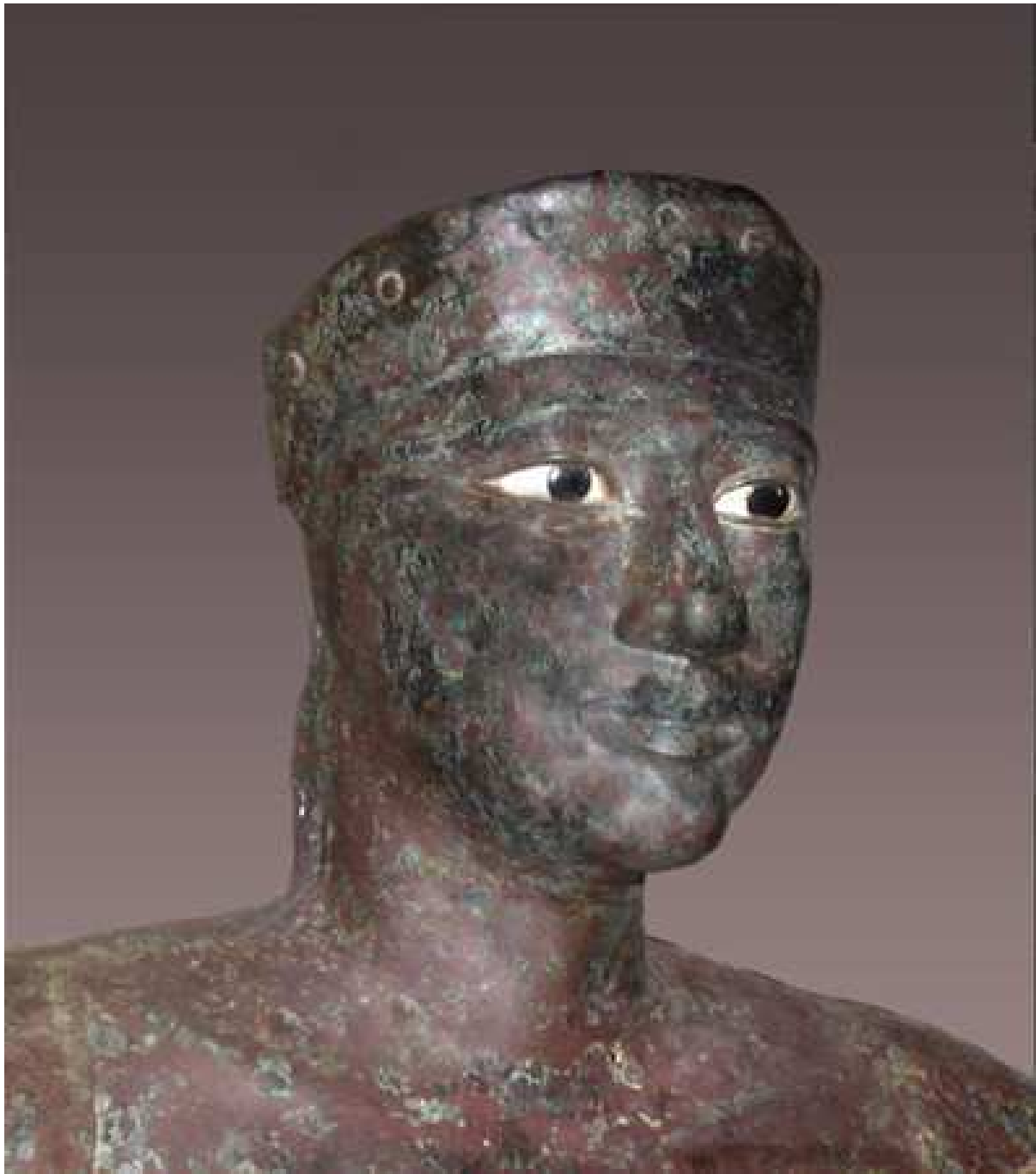
Statue de 1.77m, en cuivre , du roi Papyrus Ier.

Elle fut découverte à Hiérakonpolis et conservée au Musée du Caire.