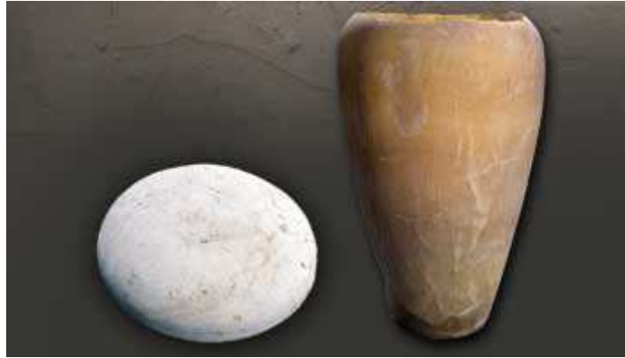
Un vase canope canope et couvercle.

http://www.culture.gouv.fr/culture/arcnat/saqqara/fr/decouverte/decouv_cav/decouv_cav4.htm