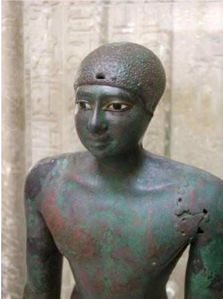
Le pharaon noir Pépi I... 6e dynastie 2 350 - 2180. Aimé de Râ.

Probablement, du au fait que ces deux éléments furent de constitution bien différente (?)... En plâtre ?