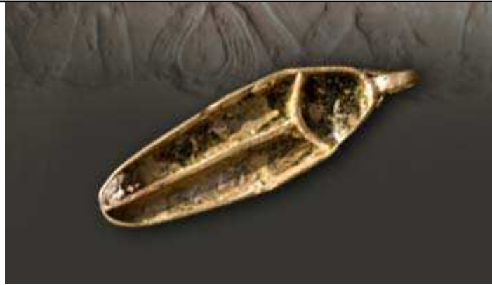
Perle d'un collier.