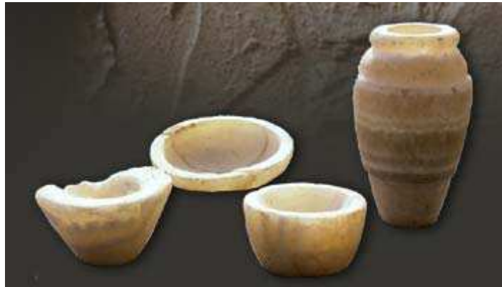
Vase et coupelles miniatures.