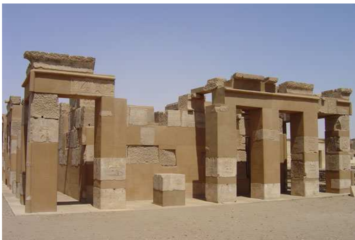
Temple de Satis, épouse de Khnoum... Construit sous le règne d'Hatchepsout !