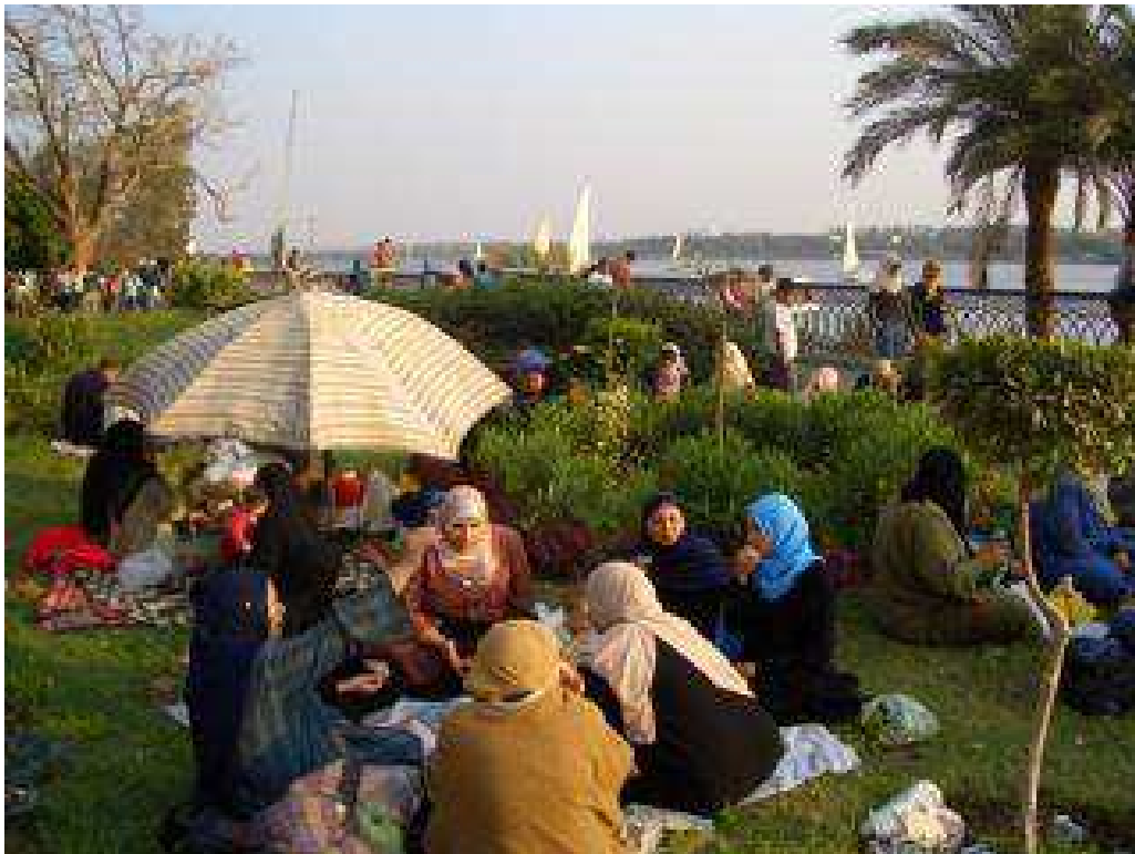
Pique-nique à Sham el-Nasim.