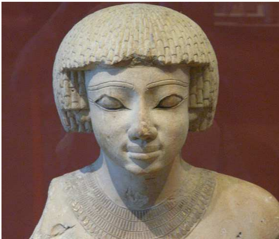
Statue d'Iahmès Sapair.

→ Article n°1 : Ahmosis et les cheikhs du désert oriental !