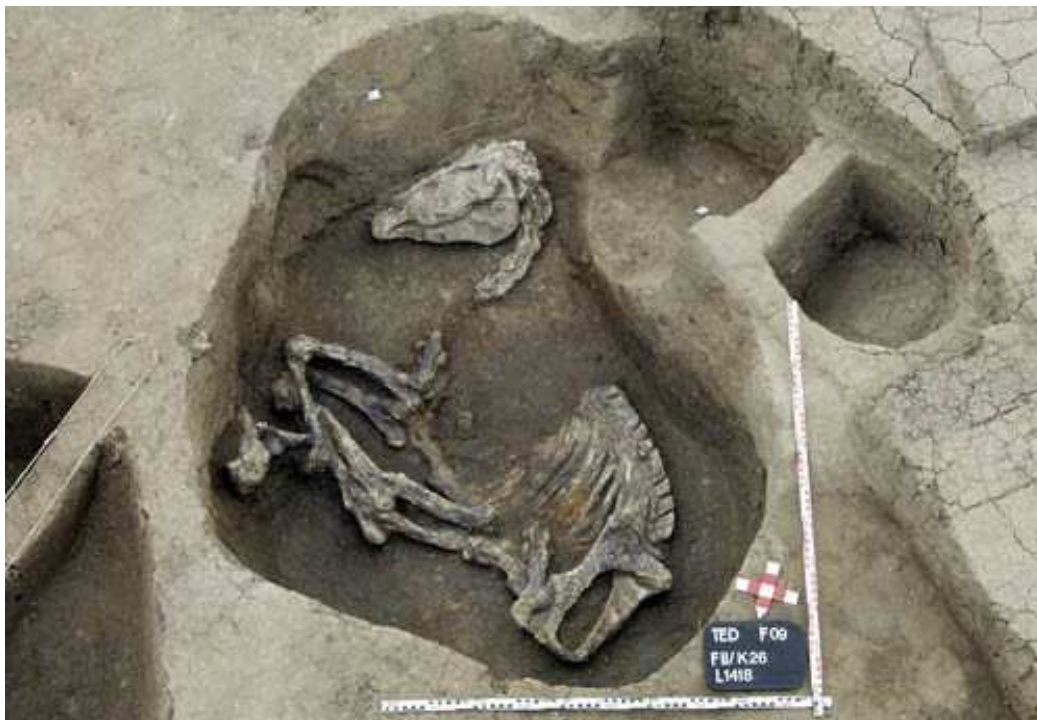
Squelette de cheval Hyksôs découvert à Tell el Daba !

Les chevaux ont été introduits en Égypte par les Hyksos.