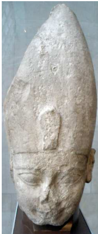
Tête d'une statue de calcaire...

Ahmosis I portant la couronne blanche de Haute-Égypte !