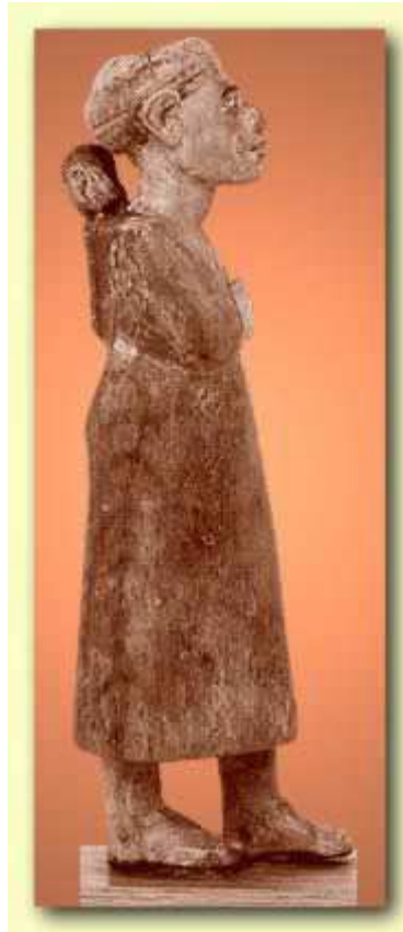
Femme Hyksôs portant son enfant !

Les Hyksôs furent probablement considérés à la manière de véritables Apophis Humains !