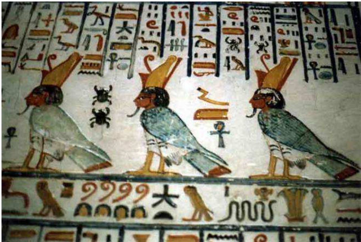
Hypogée de Ramsès VI.

Nebmaâtrê-Méryamon Ramsès-Amenherkhépeschef-Netjerhéqaiounou.