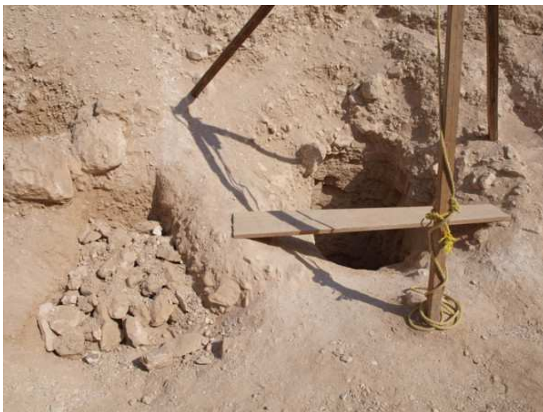
KV 40 and feature KV 40b... ! Source / Lien