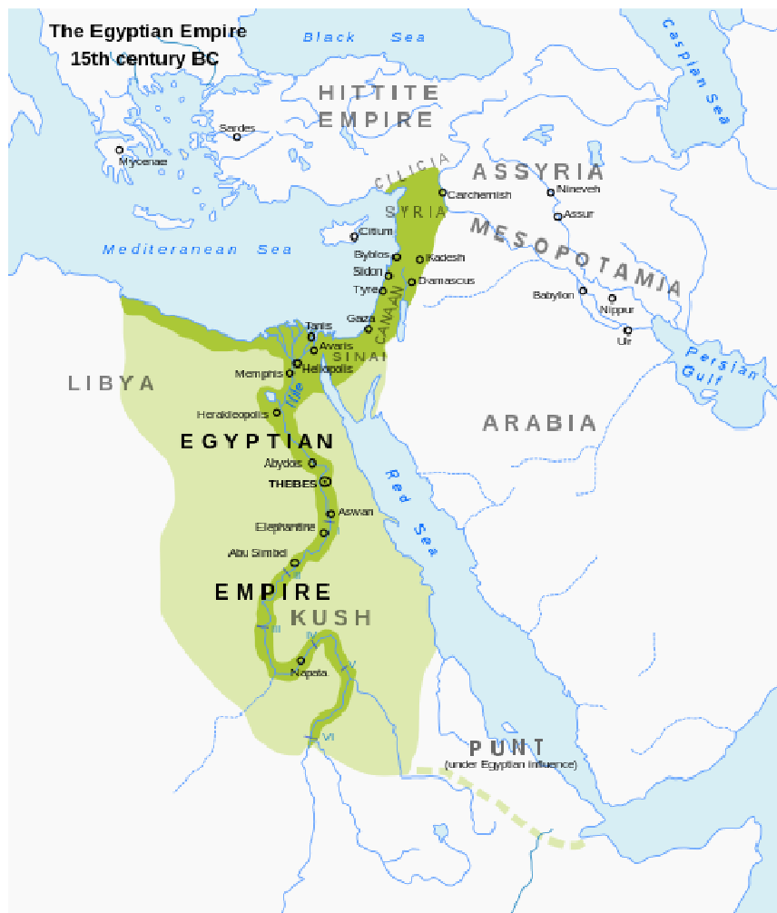
L'étendue de l'Égypte antique à son apogée territoriale sous la 18e dynastie !