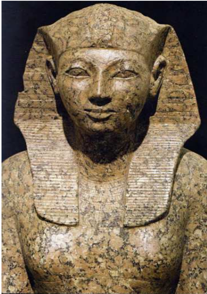
Hatchepsout avant son couronnement...