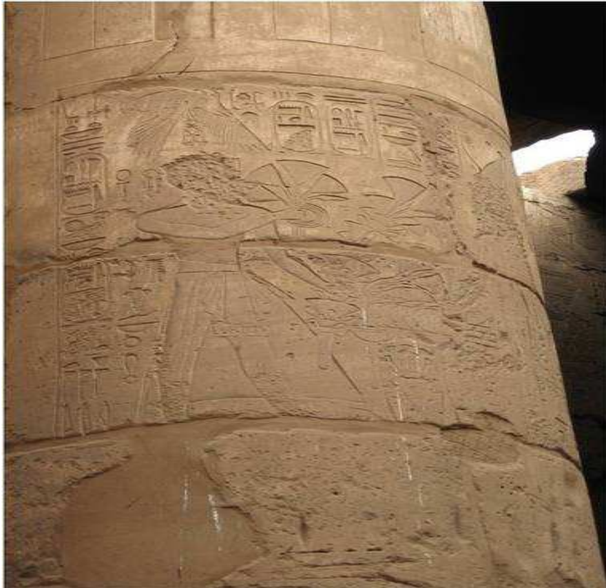
Hérihor dans le temple de Khonsou.