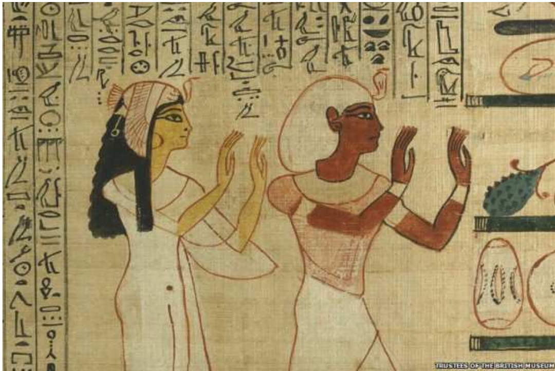
Pharaon et la Reine Herihor Nodjmet...