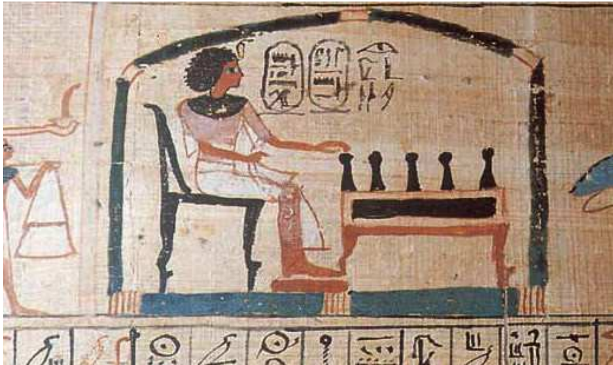
Hérihor jouant au Senet !