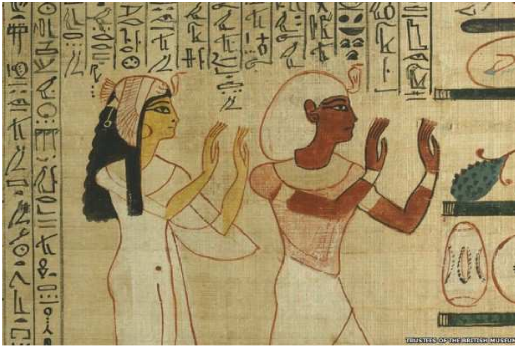
Pharaon et la Reine Hérihor Nodjmet...