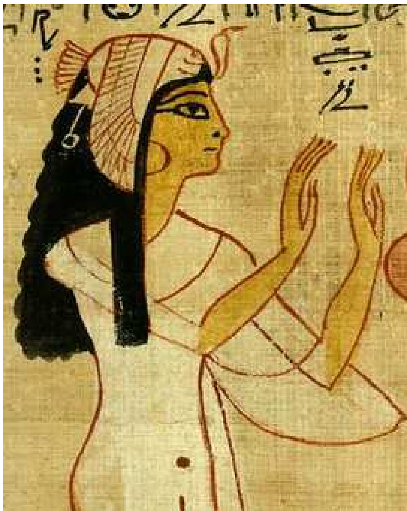
La Reine Nodjmet...