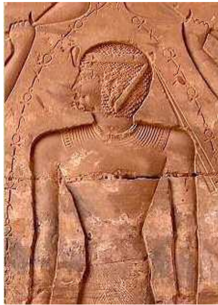
Hérihor. Temple de Khonsou.