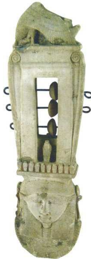
Sistre hathorique avec figure féminine !

Les représentations du netjer Nehemet-Aouy sont souvent proches de celles d'Hathor, d'Isis, de Renenoutet. Musée de Marseille.