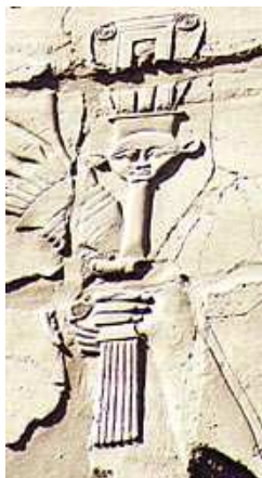
Salle Hypostyle de Karnak.

De ses cornes, partent des fils métalliques en forme de fer à cheval, agrémentés de petites cymbales ou d'une extrémité recourbée qui provoque un son en heurtant le cadre.