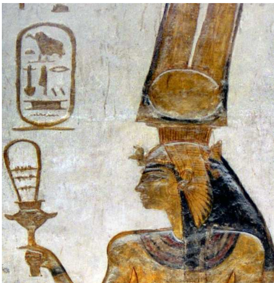
Nefartari tenant un sistre à Abou Simbel !

Appartenant au domaine du sacré, le sistre est un instrument authentiquement Égyptien qui remonte certainement à la préhistoire !