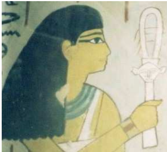
Hypogée de Sennefer !