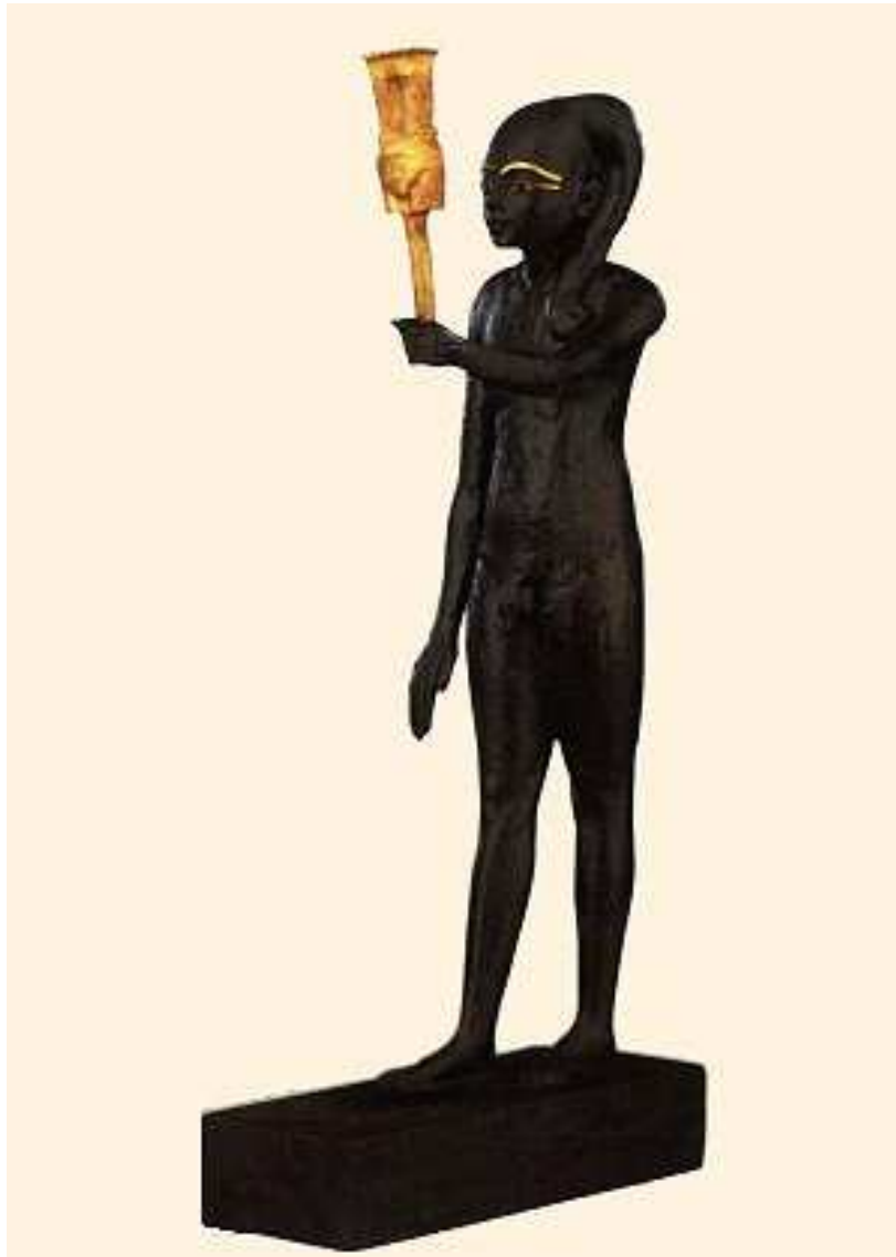
Hypogée de Toutânkhamon... 18e dynastie... Statuette en bois bitumé d'une hauteur de 63,5 cm... Musée égyptien du Caire.