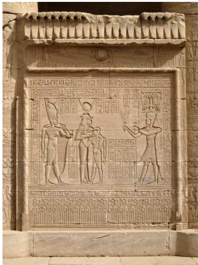
Mammisi de Trajan. Le temple de Dendérah. Hathor allaitant son fils Ihy.