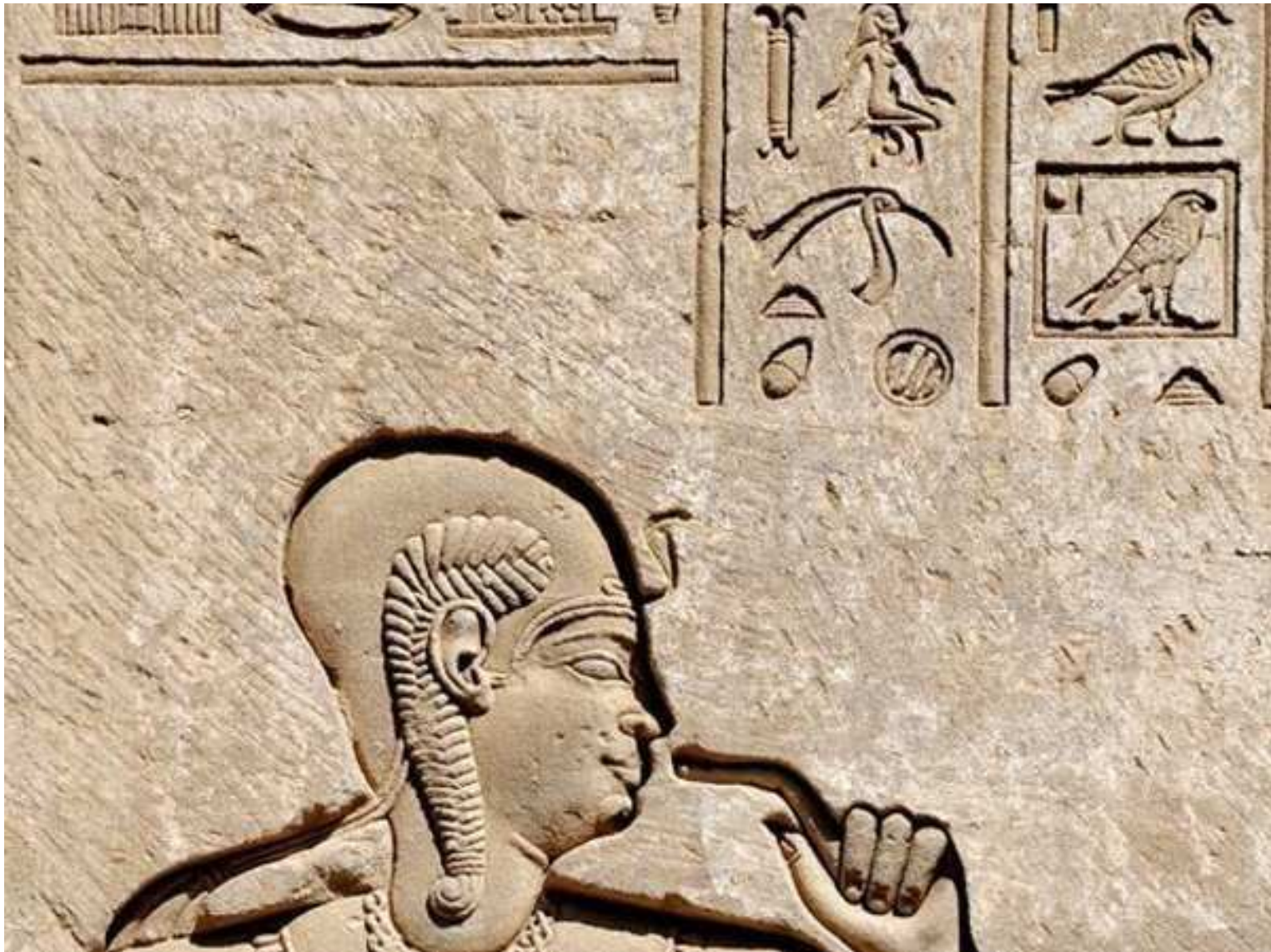
Voici quelques détails du troisième mur intercolumnnes, face sud extérieure, de la "maison de naissance" du sanctuaire de la netjeret Hathor à Nitentore, Denderah. Ihy dans son aspect de jeune netjer.