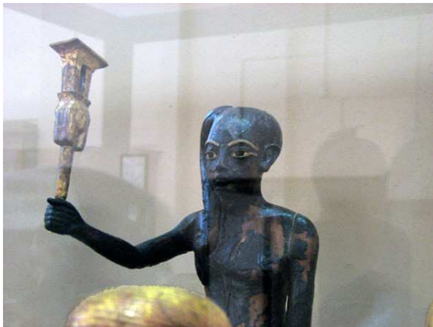
Hypogée de Toutânkhamon...