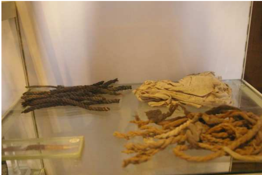
Cordes et tissu de lin.