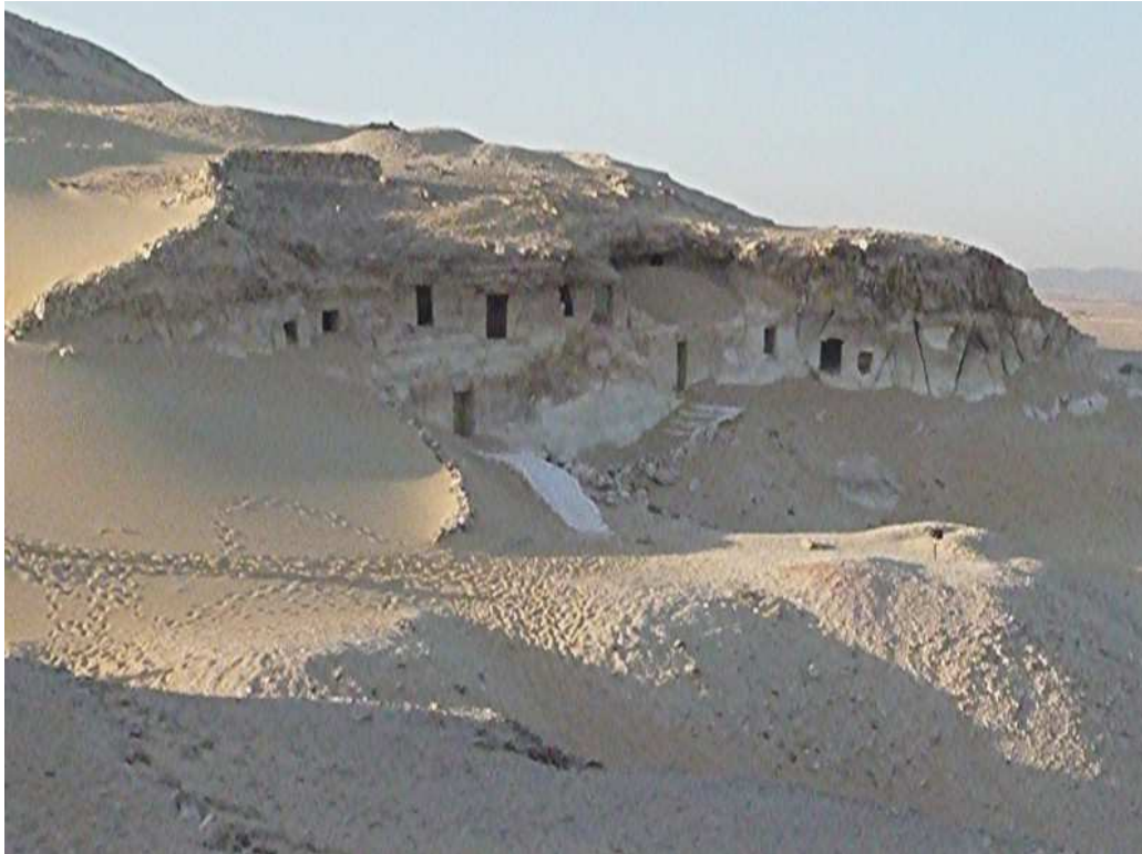
Tombe de Meir en Moyenne-Égypte...