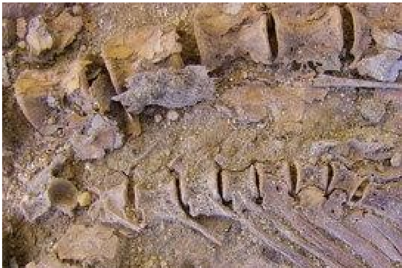
Deux squelettes de deux poissons de taille différente ...