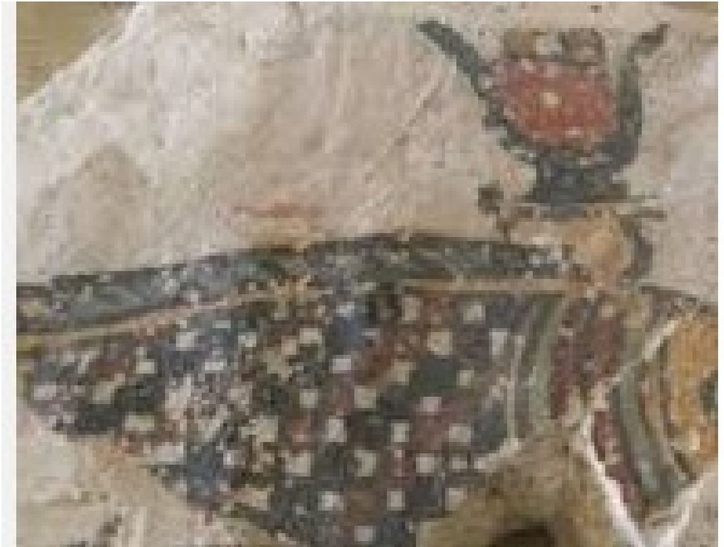
Image of an oxyrhynchus fish found in Tomb 18.

Les fouilles sont bien loin d'être terminées !