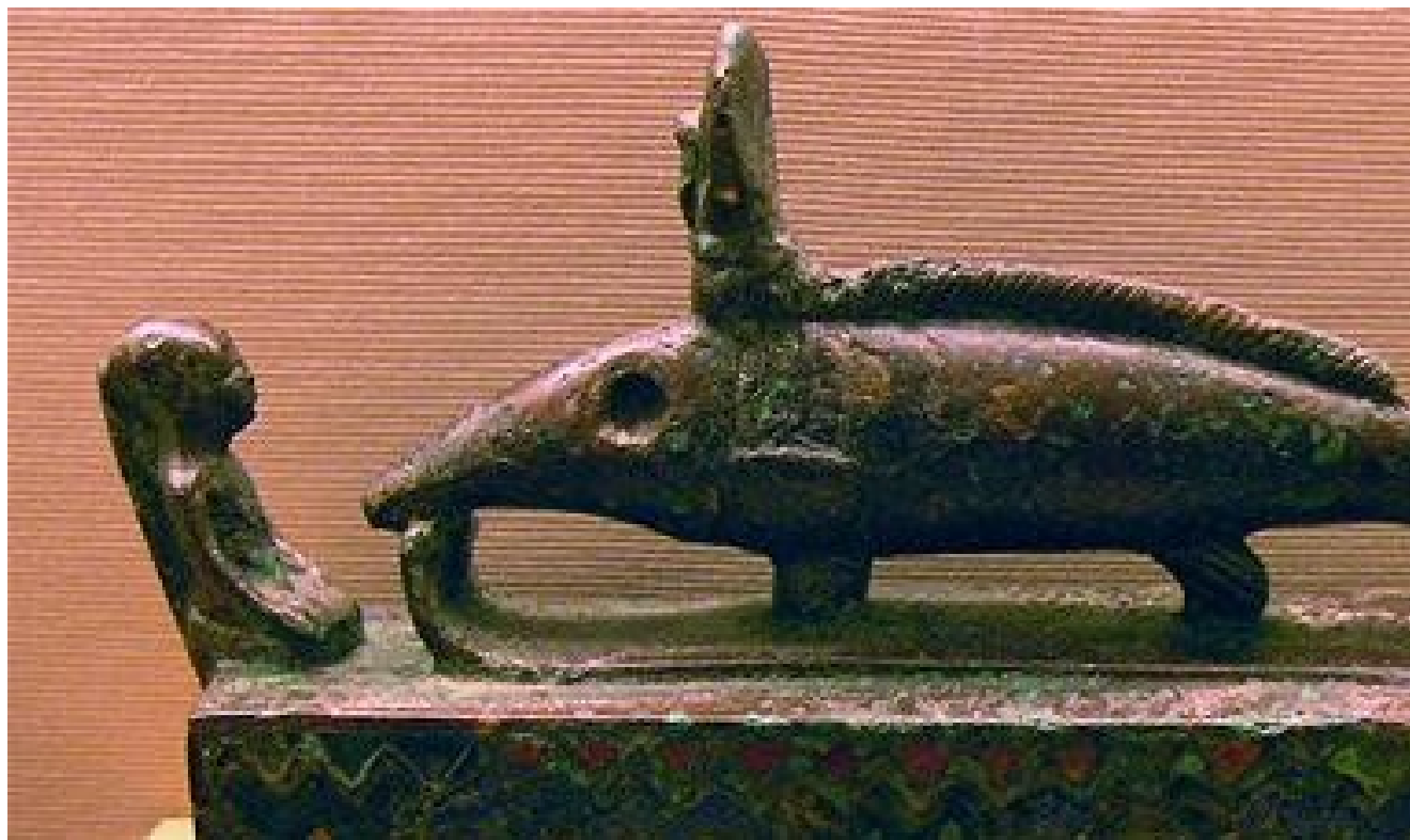
Oxyrhynque adoré par un prêtre agenouillé.