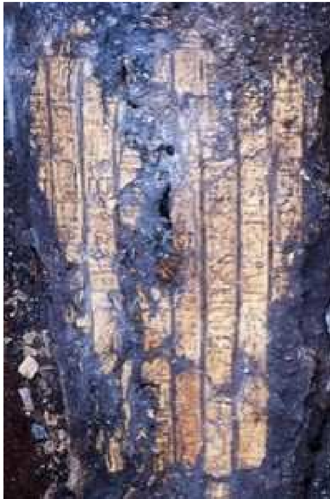
Le cartonnage doré et décoré avec du texte hiéroglyphique et le cartouche de pharaon Psammétique I de la 26e dynastie