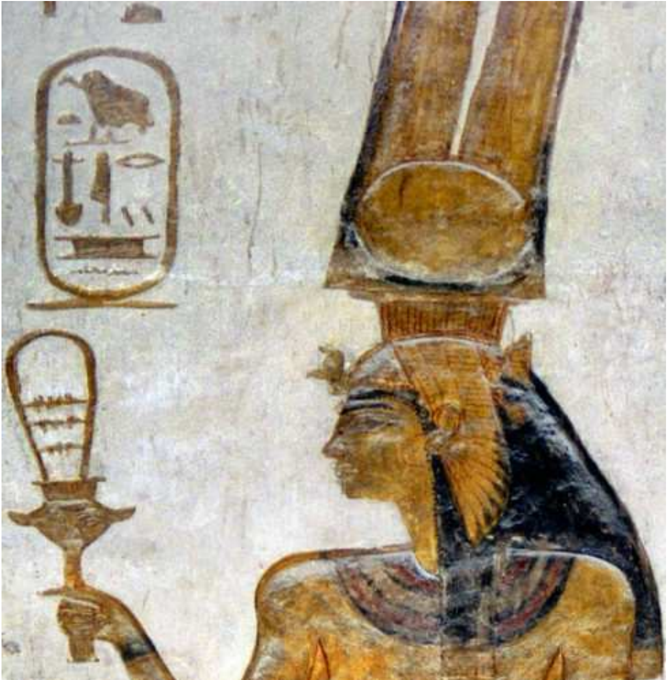
Nous sommes bien au temple d'Abou Simbel ! Nous pouvons ainsi y admirer Nefartari, l'épouse de Ramsès... La netjeret "Harthor Nefartari" avec le fameux sistre !