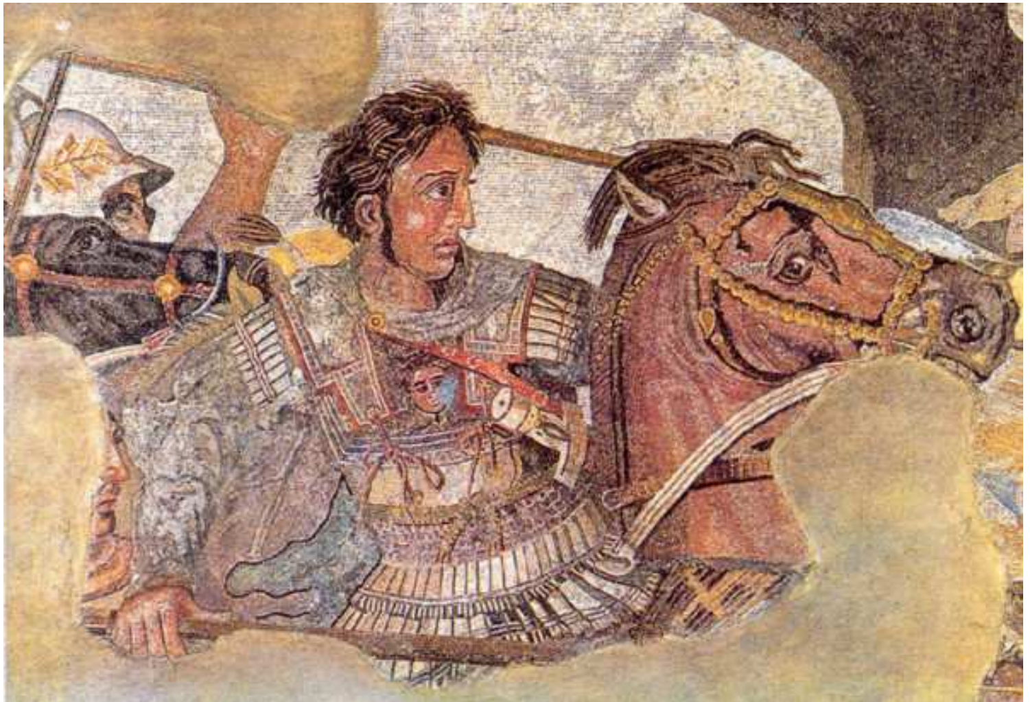
Mosaïque d'Alexandre le Grand. 333 avant l'ère du Christianisme...