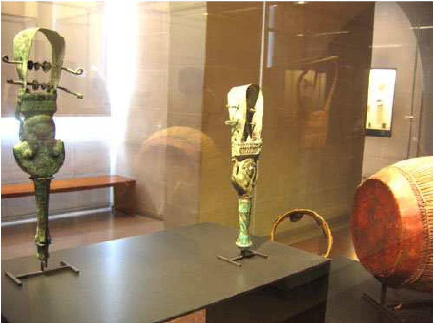
Sistres de la netjeret Hathor comme vous savez... Hochets musicaux que l'on agitait pour honorer les divinités...