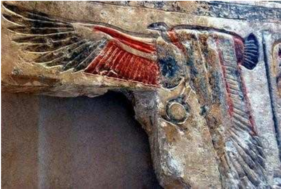
Nekhebet tenant l'anneau Chen...