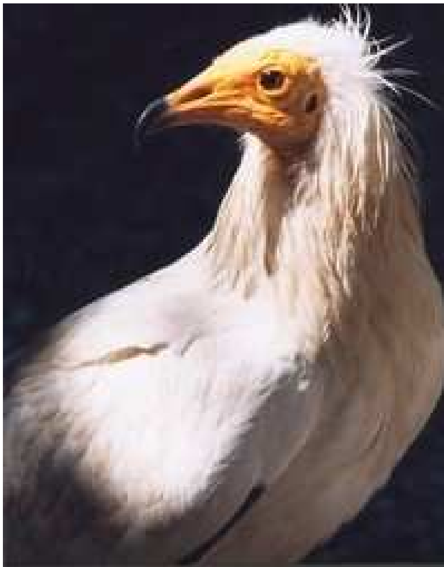
Le percnoptère... Neophron percnopterus, L... Vautour égyptien... Source / Lien