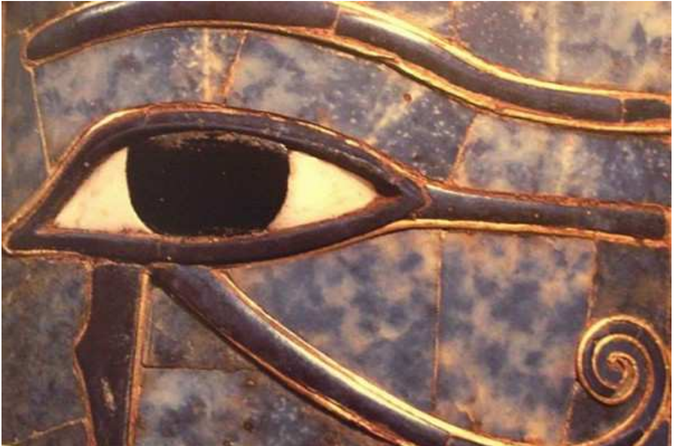
Irt Oudjat... "œil préservé" ... L'œil d'Horus...