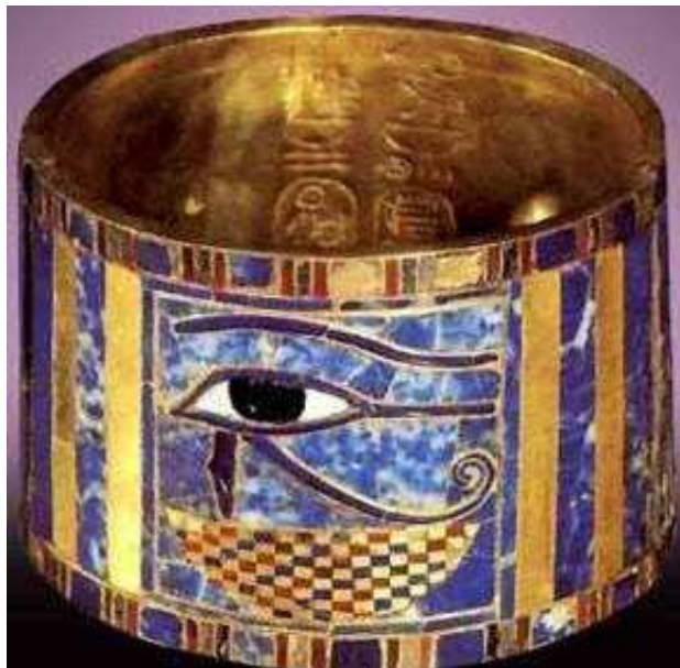
Parmi le trésor de Sheshonq II...

Souvenez-vous, le souverain avait cette obligation essentielle, celle d'empêcher la terre de sombrer dans le chaos !