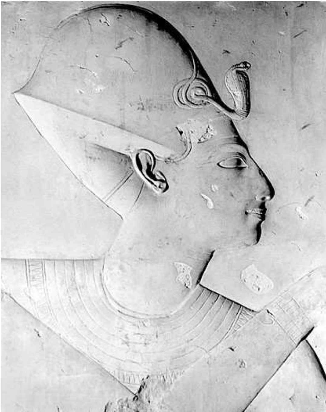
Sésy I. Source / Lien