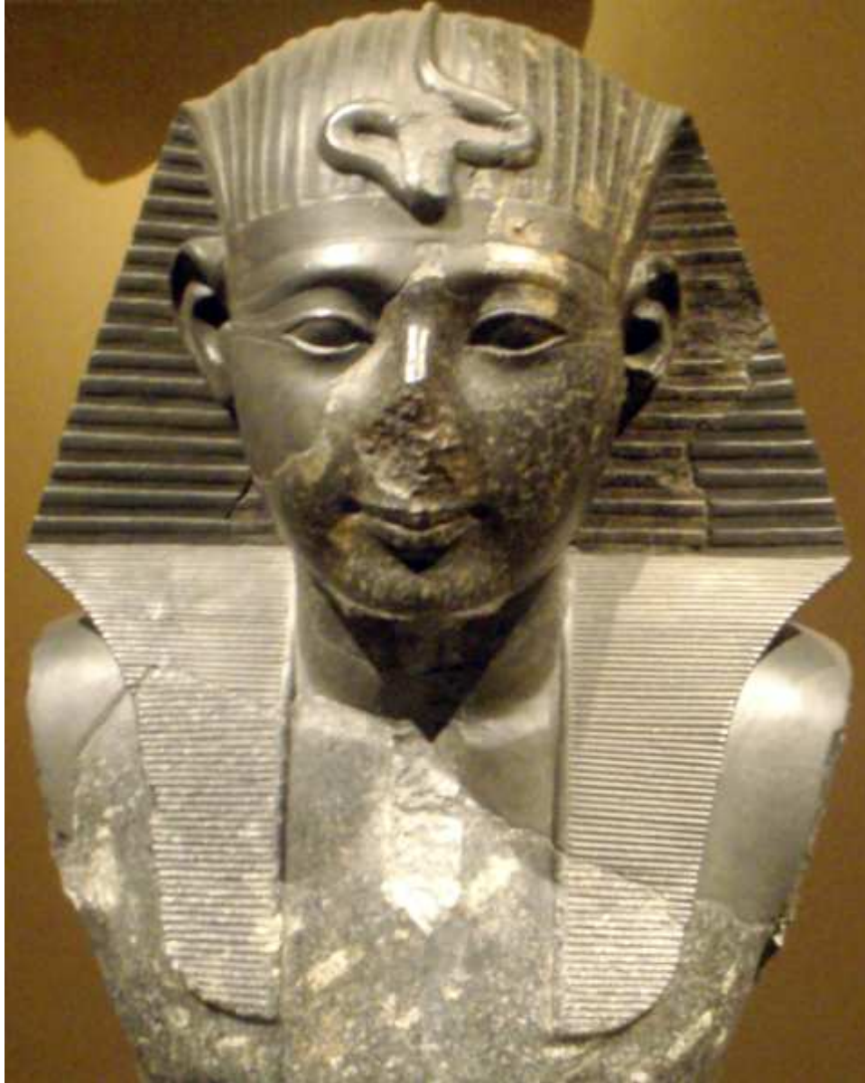
Statue du pharaon Seti I...

Souvenez-vous, nous sommes pratiquement à la sortie de cette période bien inédite et mouvementée du reste dans l'Histoire pharaonique, celle relative à Akhet-Aton !