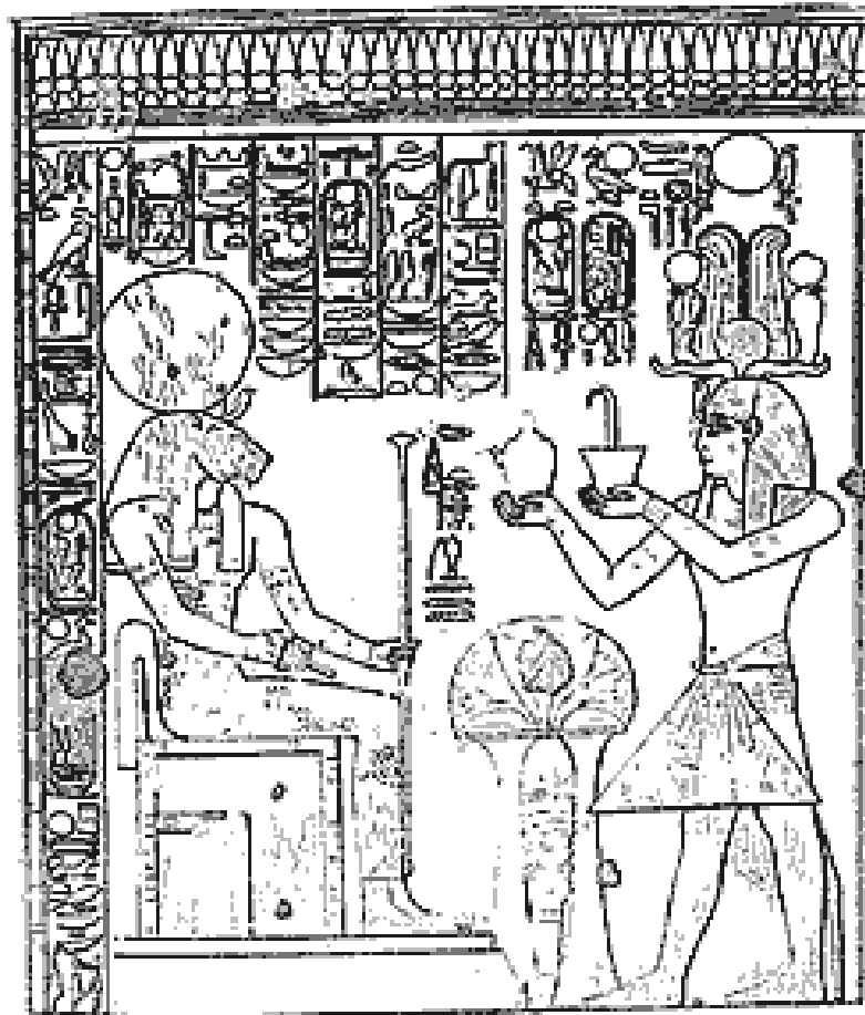
Pakhet est coiffée du globe solaire ! Séthi I offrait ici une libation et une fumigation à la netjeret Pakhet... P3h t.