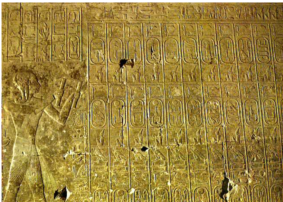
Liste des cartouches des pharaons dans le temple de Séthi I. 19e dynastie... Abydos.