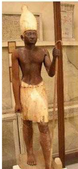
Voici le fils et successeur d'Amenemhat I, le pharaon Sésostris I...