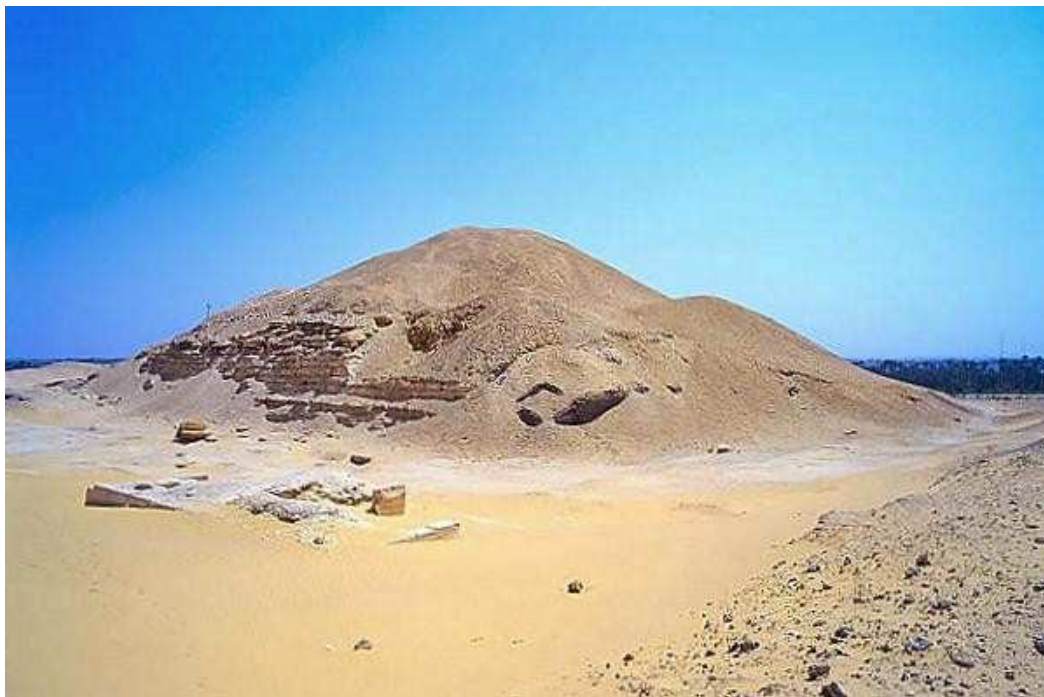
La pyramide d'Amenemhat I. Pharaon fondateur de la 12e dynastie...