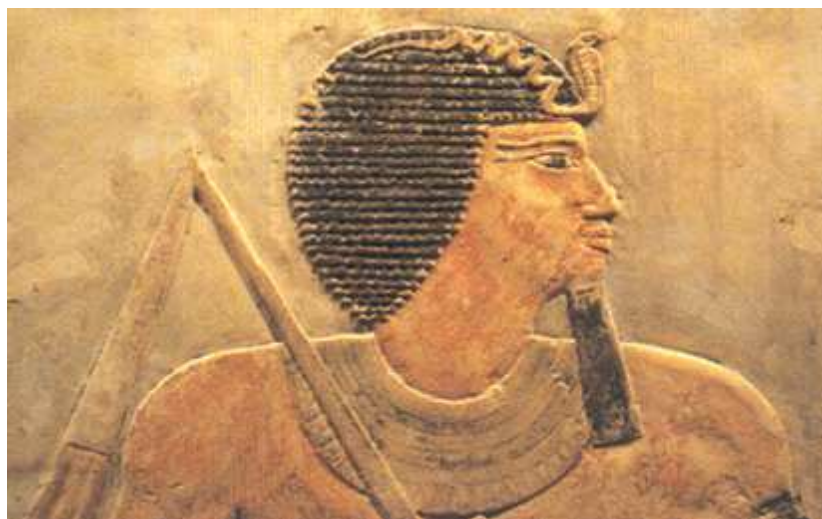
Linteau : el-Licht. Metropolitan Museum.