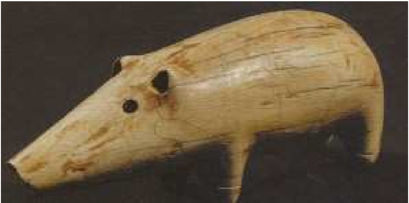
Petit sanglier en ivoire d'époque prédynastique...

Au sein même probablement du nid familial... ! (?)