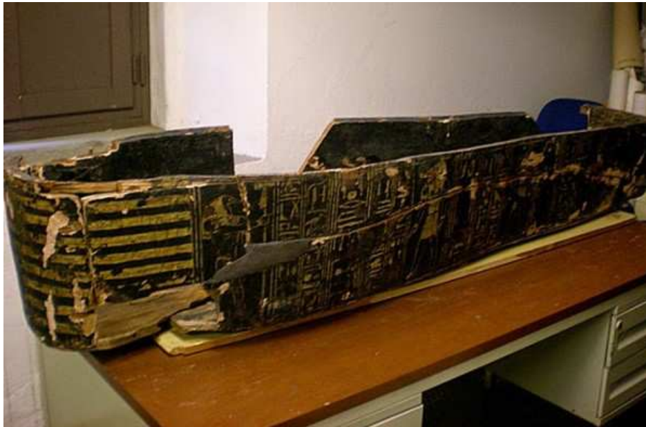
Le sarcophage en cours de restauration...