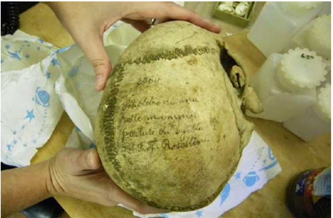
Le crâne de l'inscription à l'encre noire...