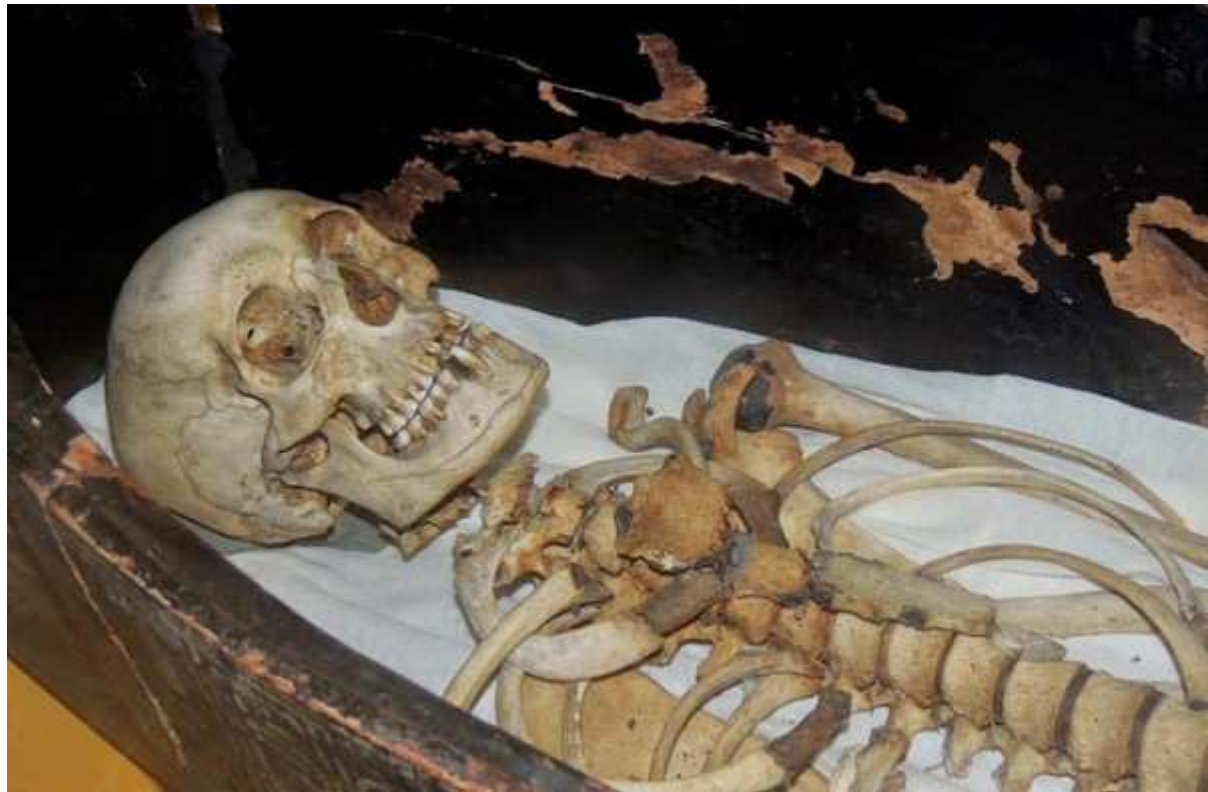
Le squelette de Qenamun.