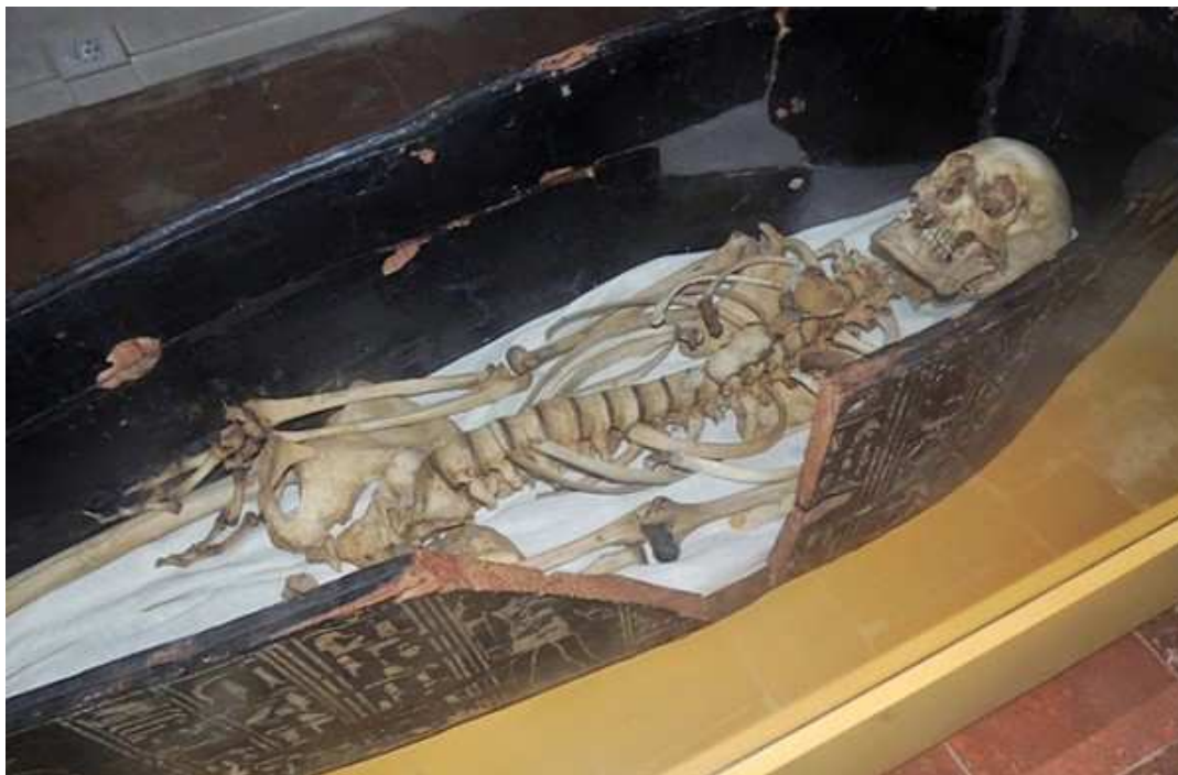
Le squelette retrouvé montre des signes noircis de la momification !