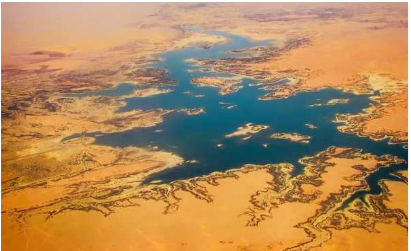
Vue aérienne du Nil...